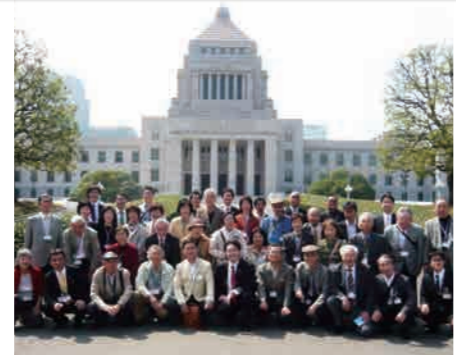
国会ツアー！ 吉野家の「牛重」も食べられます！