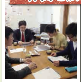
歴史勉強会！ 20代限定の勉強会です。 若き同志よ、来たれ！