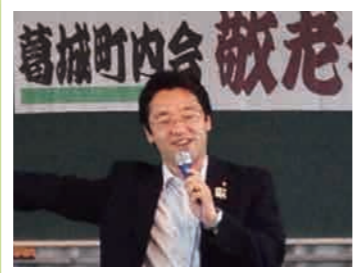
敬老会で得意の歌を披露♪