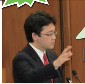
11月1日 財務金融委員会にて(他2回質問)

政治は国家を「経営」するもの。しかし今はまともな経営の仕組みになっていない。その結果、国家財政も危機的状況。緊張感を持って改革に取り組まなければならない。中期財政計画の目標を達成できなかった場合、誰が責任を取るのか？