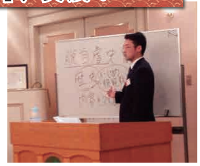
倫理法人会で講話