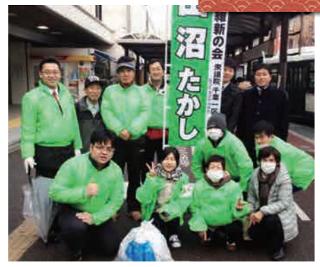
稲毛駅前クリーンクラブ！ 月1回の駅前掃除です。 終了後はおしゃべり会も実施！