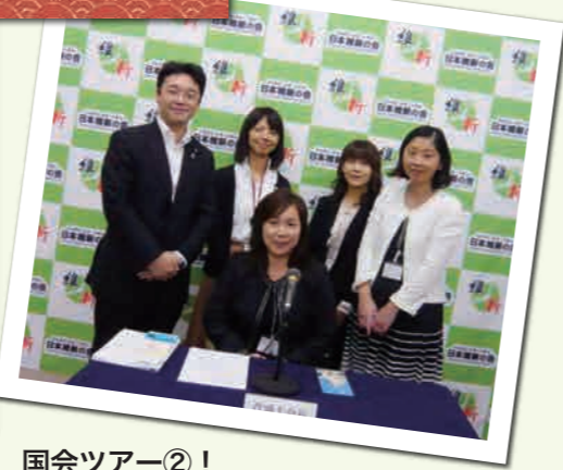
国会ツアー②！ 少人数から受け付けています！