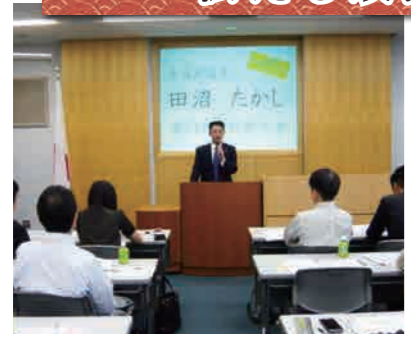
好評の国政報告会！ 出前報告会も随時実施！ 政策を語り合ひましょう！