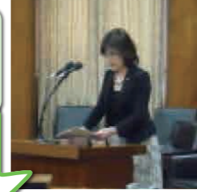
福田朋美行革担当大臣

今は、大臣に人事権が実質無い。これが、霞ヶ関を政治がガバナンスできない、最大の問題だ。改善するには、大胆な抜擢・降格人事を可能にする必要があるが、職員の身分保障制度によりそれは阻まれている。民間同様、幹部は身分保障をなくすべきでは？