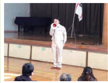
地域の防災訓練に参加

人数の多少に関わらず、地元の集まり・地域のイベント等ございましたら、ぜひお知らせください♪