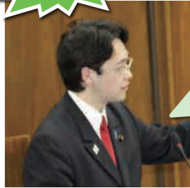
3月27日 文部科学委員会にて(他5回質問)

教育委員会は問題対処能力を失っている。様々な教育問題の根源はここにある。愛国心を養える教科書が選ばれないのも、いじめ問題の対処不足も、そのせい。しかし「教育の政治的中立性」にこだわるあまり、首長の意向は教育行政に反映できない構造だ。結局、首長が「こういう教育がしたい！」と選挙で訴えられない。住民の声も届かない。おかしいのでは？