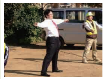
防災訓練でラジオ体操