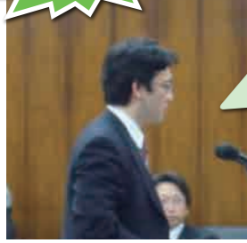
11月27日 内閣委員会にて(他1回質問)

今は、大臣に人事権が実質無い。これが、霞ヶ関を政治がガバナンスできない、最大の問題だ。改善するには、大胆な抜擢・降格人事を可能にする必要があるが、職員の身分保障制度によりそれは阻まれている。民間同様、幹部は身分保障をなくすべきでは？