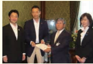
6月5日、中田宏議員と共に衆議院事務総長へ提出

私が衆院選挑戦を決断した最大のテーマである、教育委員会改革。その切り札となる「教育委員会廃止法案」を、日本維新の会単独で提出しました。中田宏・前横浜市長をリーダーに、私も中心メンバーとして作成したものです。